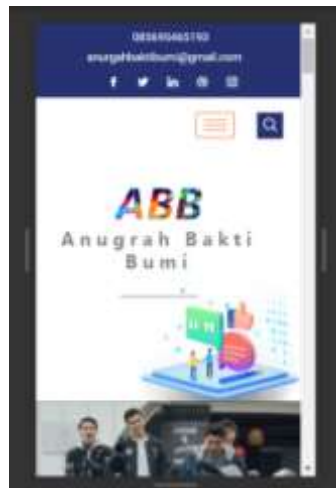
Gambar 3 tampilan secara mobile

Bentuk dari sistem Wordpress ini sendiri ada bermacam, diantaranya adalah berbasis web, desktop serta mobile. Selain itu, perangkat lunak ini memiliki banyak kelebihan seperti memiliki komunitas pengguna yang besar dan dinamis, jumlah website yang menggunakan wordpress yang telah banyak tersebar, memiliki kemudahan dalam perubahan desain, mudah digunakan/dipelihara, Berbagai plugin-plugin, baik yang gratis maupun berbayar, membuat WordPress menjadi salah satu aplikasi open source yang paling banyak dipakai untuk mengelola konten (Pratiwi, D., Santoso, G., B., Mardianto, I., Sedyono, A., Rochman, A., (2020)).