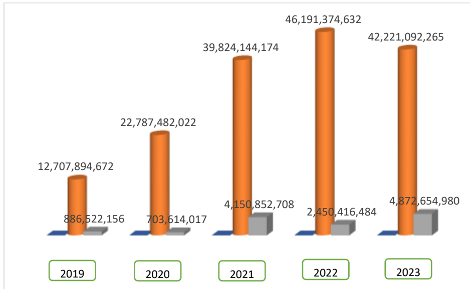
Gambar 1 Perbandingan Omzet Terhadap Laba Bersih

Dapat dikatakan bahwa omzet perusahaan merupakan salah satu indikator kunci dalam menilai kinerja finansial suatu bisnis. Gambaran lengkap mengenai kesehatan finansial perusahaan penting untuk menganalisis bagaimana omzet ini berkontribusi terhadap laba dapat dilihat pada Gambar 1.