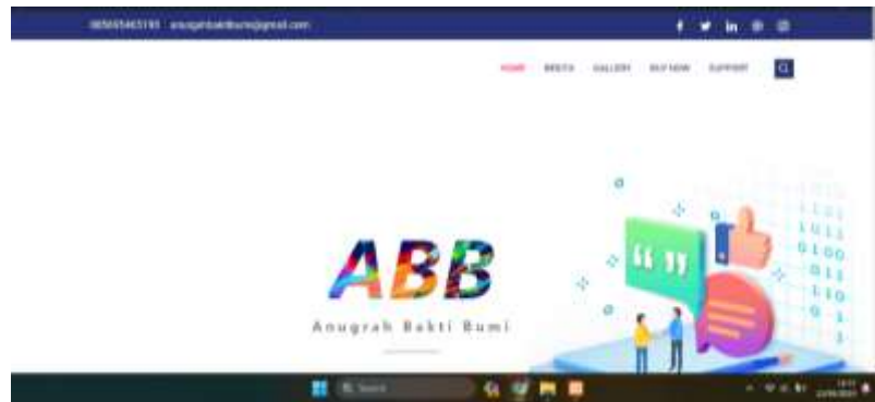
Gambar 2 Tampilan secara web

satu sistem CMS ( Content Management System) yang memberikan kemudahan kepada para penggunanya dalam mengelola dan mengadakan perubahan isi sebuah website dinamis tanpa sebelumnya dibekali pengetahuan tentang hal-hal yang bersifat teknis.