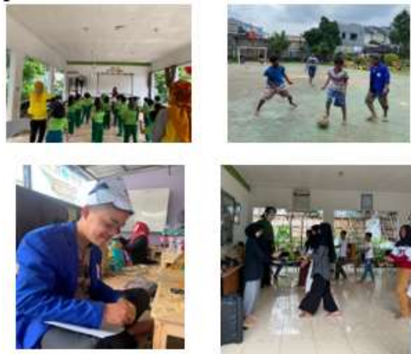
Gambar 1. 3 Program Kerja Bidang Keterampilan

Program kerja di bidang lingkungan meliputi PHBS, PSN, Tanaman Hidroponik. Yang bertujuan dapat meningkatkan hidup bersih dan sehat dalam kehidupan sehari – hari. Dengan mengajak Mengajak masyarakat untuk hidup sehat dan menjaga lingkungan dengan media tanam hidroponik bekerjasama dengan pengelola RPTRA Sehingga warga merasa senang dengan kehidupan lingkungan yang sehat dan bersih.