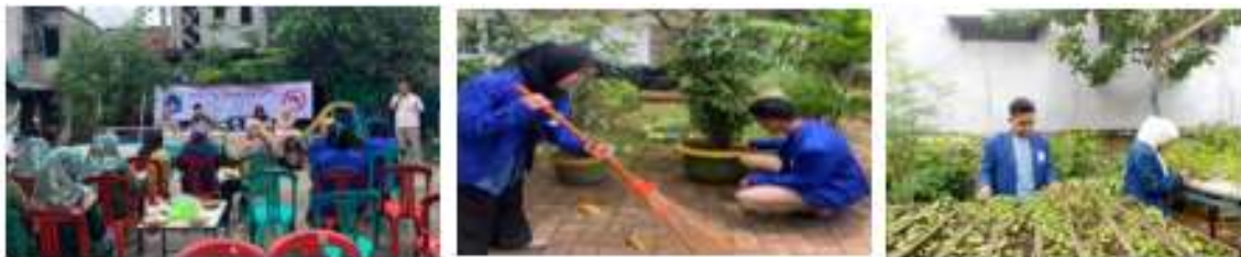
Gambar 1. 4 Program Kerja Bidang Lingkungan

Program kerja di bidang lingkungan meliputi PHBS, PSN, Tanaman Hidroponik. Yang bertujuan dapat meningkatkan hidup bersih dan sehat dalam kehidupan sehari – hari. Dengan mengajak Mengajak masyarakat untuk hidup sehat dan menjaga lingkungan dengan media tanam hidroponik bekerjasama dengan pengelola RPTRA Sehingga warga merasa senang dengan kehidupan lingkungan yang sehat dan bersih.