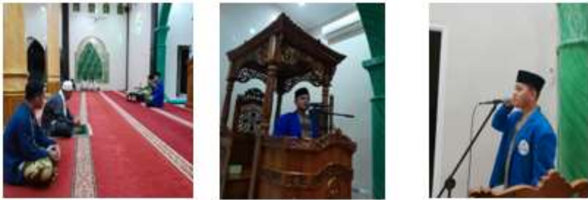
Gambar 1. 5 Program Kerja Bidang Agama