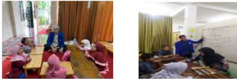
Gambar 1. 2 Program Kerja Bidang Ekonomi

Program kerja bidang ekonomi meliputi Pelatihan Kewirausahaan dalam meningkatkan ekonomi keluarga. Kemudian peningkatan pengetahuan tentang internet marketing dikalangan guru PAUD. Sedangkan Pelatihan di harapkan sebagai upaya untuk memiliki penghasilan tambahan, dengan berwirausaha di social media. Sehingga mampu menjaga kesejahteraan keluarga malalui peningkatan ekonomi, mengingat ekonomi adalah salah satu factor banyaknya terjadi perceraian di daerah ibu kota Jakarta. Hasil yang dicapai dengan adanya kegiatan ini Warga merasa senang dan memiliki kesempatan menjadi pengusaha.