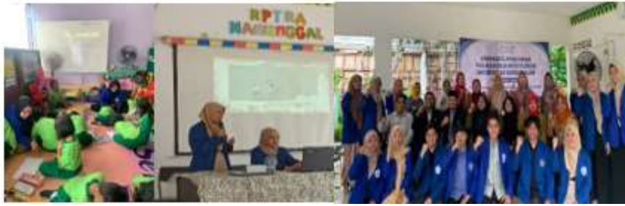
Gambar 1. 1 Program Kerja Bidang Pendidikan

Program kerja bidang ekonomi meliputi Pelatihan Kewirausahaan dalam meningkatkan ekonomi keluarga. Kemudian peningkatan pengetahuan tentang internet marketing dikalangan guru PAUD. Sedangkan Pelatihan di harapkan sebagai upaya untuk memiliki penghasilan tambahan, dengan berwirausaha di social media. Sehingga mampu menjaga kesejahteraan keluarga malalui peningkatan ekonomi, mengingat ekonomi adalah salah satu factor banyaknya terjadi perceraian di daerah ibu kota Jakarta. Hasil yang dicapai dengan adanya kegiatan ini Warga merasa senang dan memiliki kesempatan menjadi pengusaha.